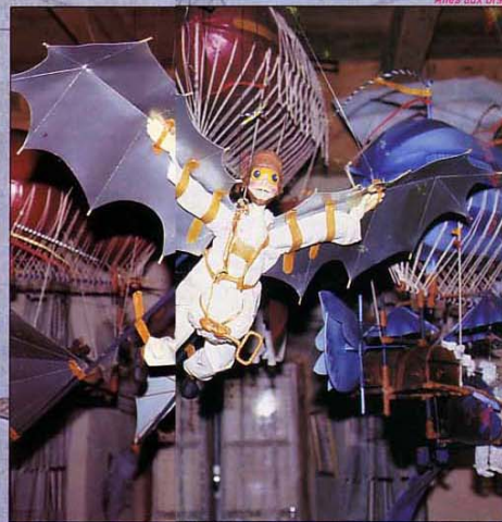
Alles aux bras

Proportions Harmoniques entre l'homme de la même proportion et la forme de l'arc.